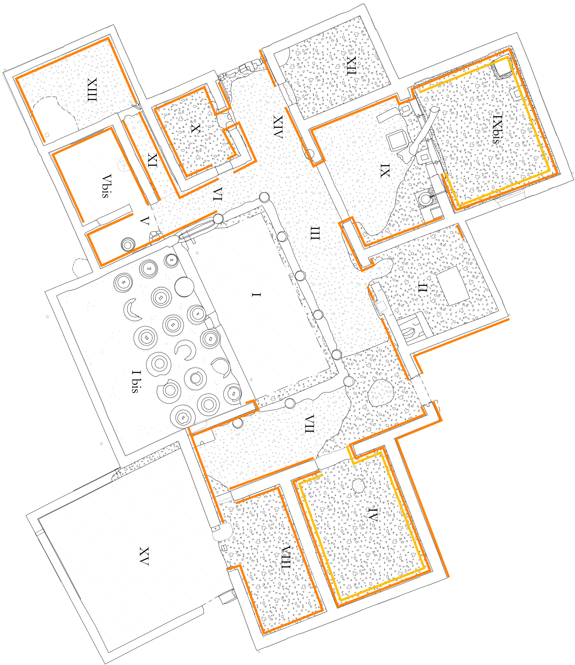
PIANO TERRA - scala 1:100