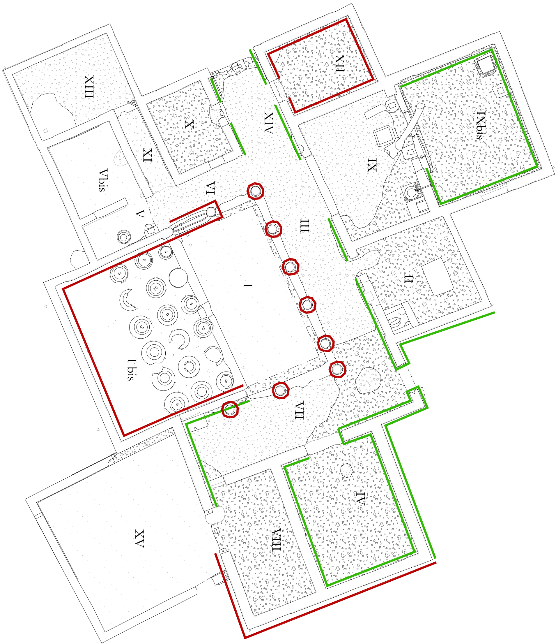
PIANO TERRA - scala 1:100